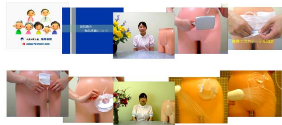
オリジナル指導用DVD