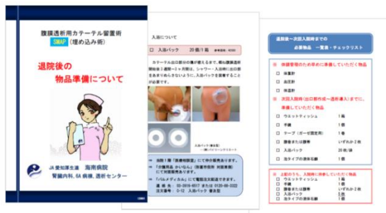
オリジナル患者指導用資料の作成

PD指導は、外来(血液浄化センター)と病棟看護師が連携をとり、PD導入期の教育指導を行い、PD維持期の外来も年次指導計画に基づいた継続指導を実施していますが、オリジナルパンフレットおよびDVDを使用し、患者の個別性に応じた教育をおこなっています。